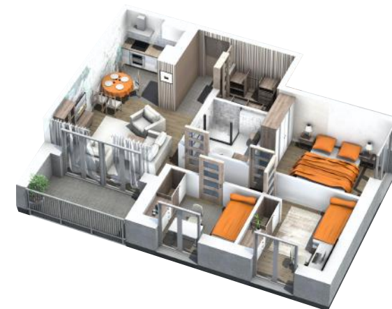
PRZYKŁADOWA ARANŻACJA MIESZKANIA