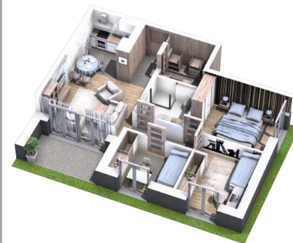
PRZYKŁADOWA ARANŻACJA MIESZKANIA