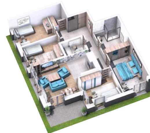
PRZYKŁADOWA ARANŻACJA MIESZKANIA