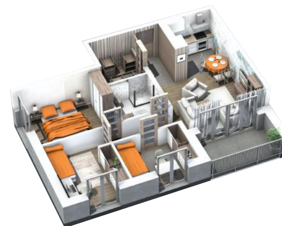
PRZYKŁADOWA ARANŻACJA MIESZKANIA