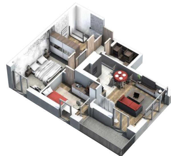
PRZYKŁADOWA ARANŻACJA MIESZKANIA