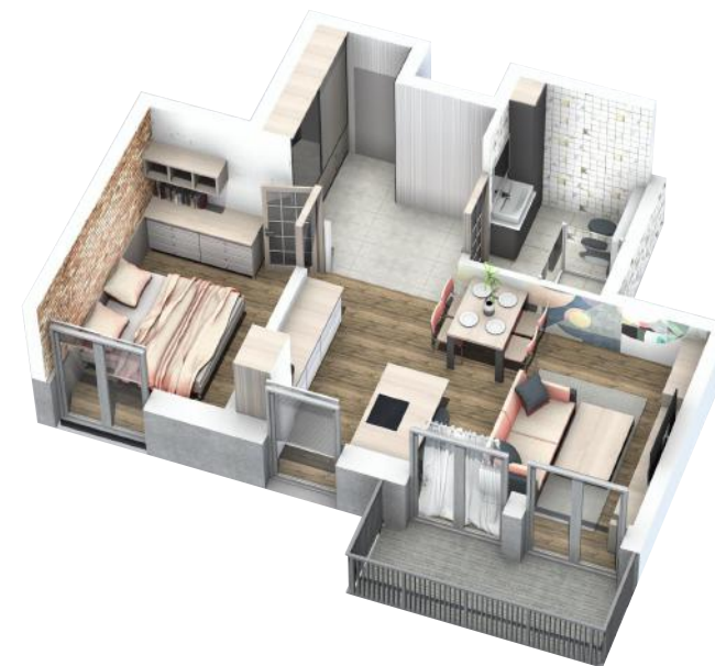
PRZYKŁADOWA ARANŻACJA MIESZKANIA