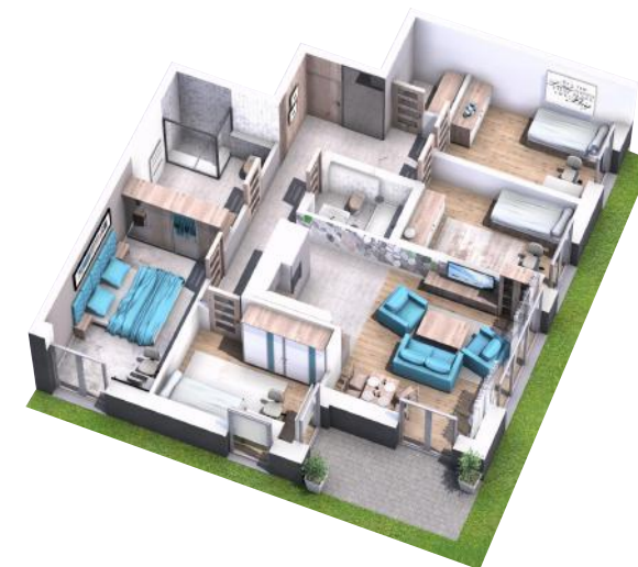
PRZYKŁADOWA ARANŻACJA MIESZKANIA