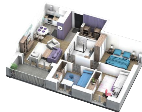
PRZYKŁADOWA ARANŻACJA MIESZKANIA