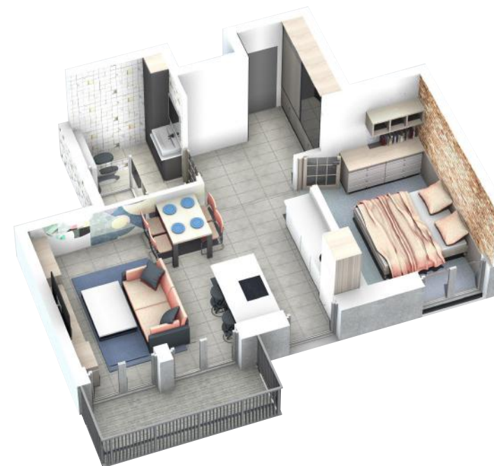
PRZYKŁADOWA ARANŻACJA MIESZKANIA