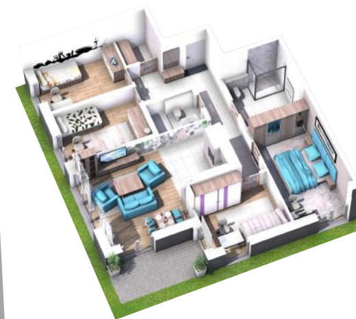
PRZYKŁADOWA ARANŻACJA MIESZKANIA