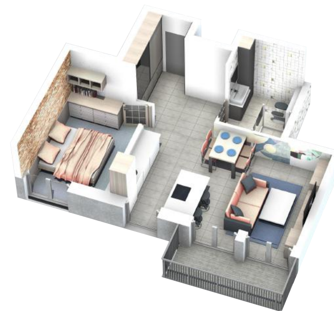
PRZYKŁADOWA ARANŻACJA MIESZKANIA