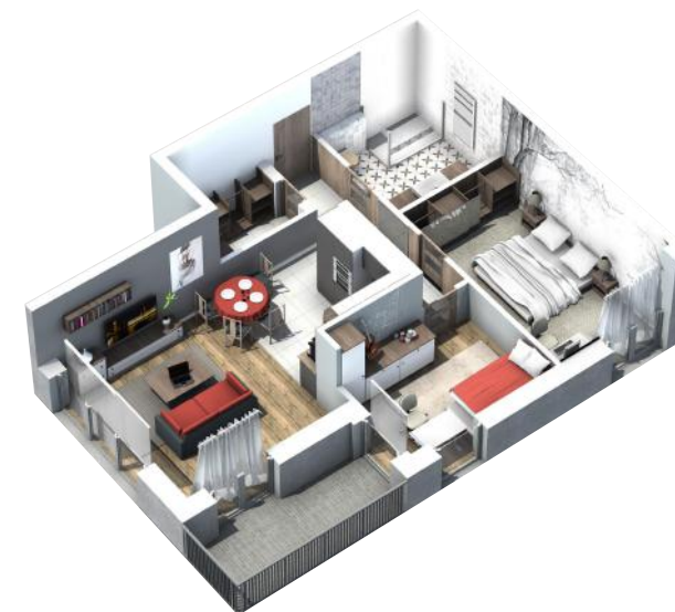
PRZYKŁADOWA ARANŻACJA MIESZKANIA