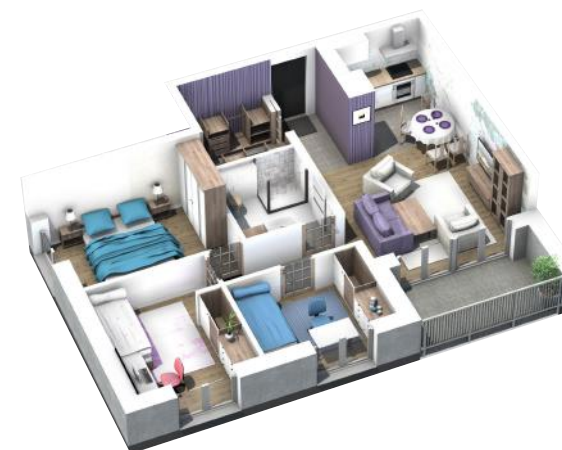
PRZYKŁADOWA ARANŻACJA MIESZKANIA