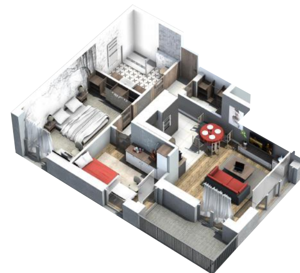
PRZYKŁADOWA ARANŻACJA MIESZKANIA