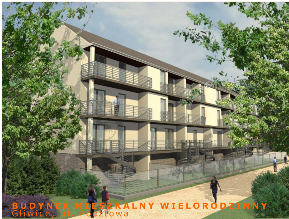
BUDYNEK MIESZKALNY WIELORODZINNY Gliwice, ul. Pocztowa